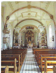
Glanz: Die Kirche Tobel mit prächtigem Altar und barockem Zierat.

13.30 weiter Richtung Kirche Tobel, Halt oberhalb, Kaffee und Kuchen von Rebekka